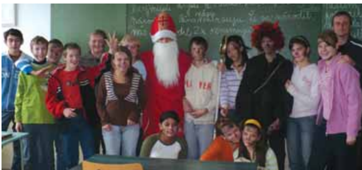
Mikuláš v základnej škole