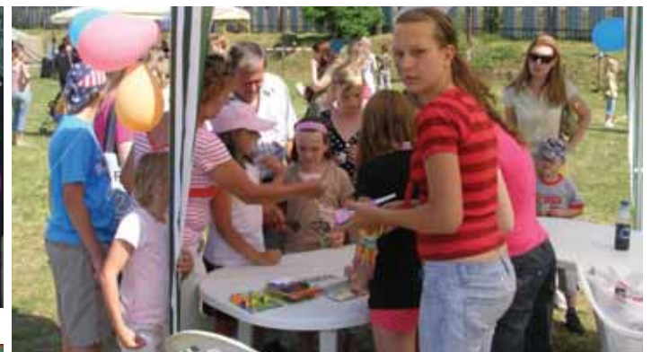
Deň obce - detský svet.