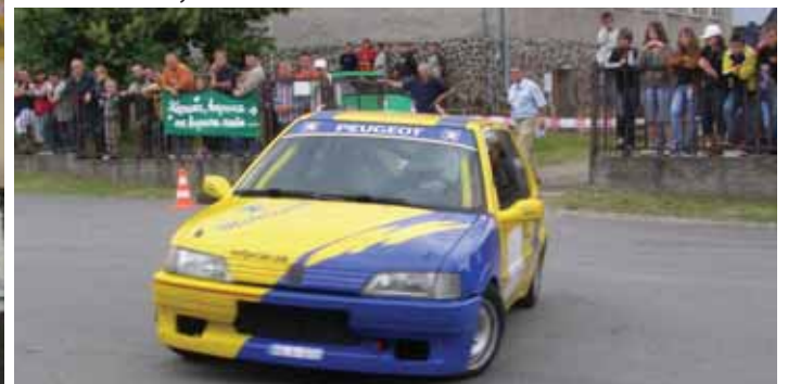
4. ruskovský automobilový slalom