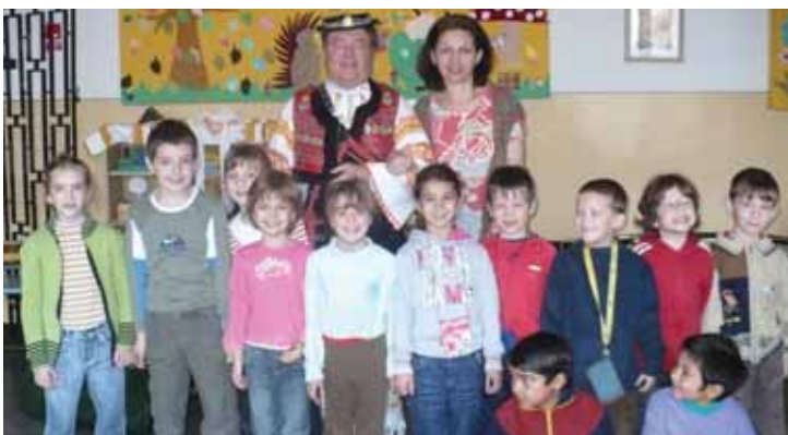
Hudobník hrajúci na rôzne hudobné nástroje v ZŠ.