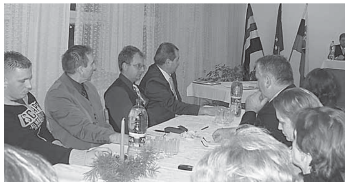
Ustanovujúca schôdza Obecného zastupiteľstva

podľa plánu práce na I. polrok 2007 5. Úprava rozpočtu na rok 2007