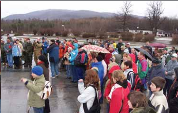
Pochod vďaky na Dargov