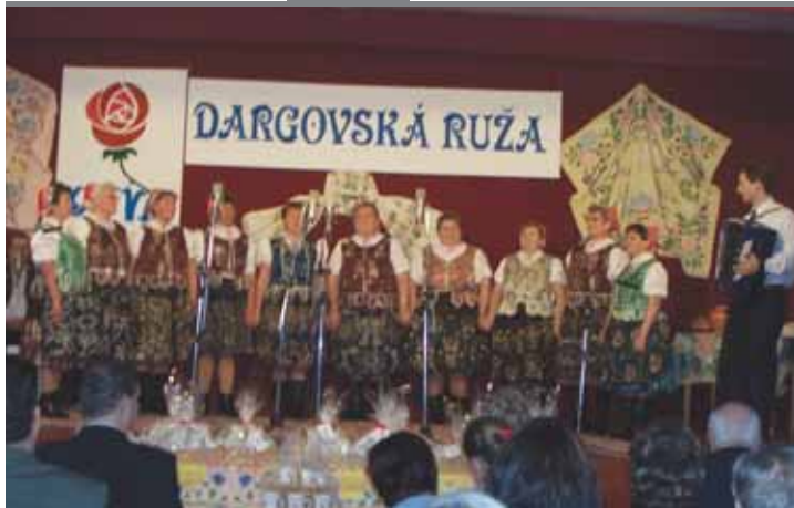
Dargovská ruža – Spevácky súbor Oľšavan